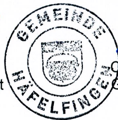
Ch. Gerhard Gemeindeschreiberin